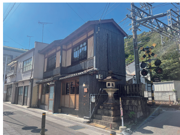
写真28 「佳山」 外観