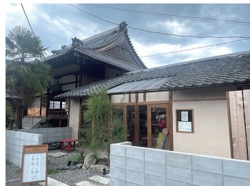
写真18 本要寺本堂横のawai