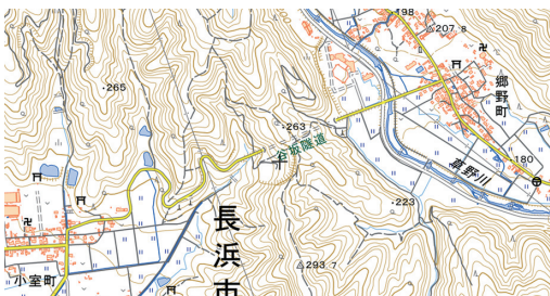
写真8 国土地理院地図（田根—上草野：広域図）