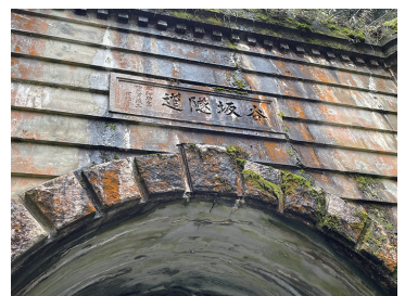
写真4 扁額「谷坂隧道 昭和拾年拾二月竣工 村地書」