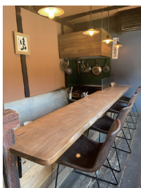
写真27 柎の木のカウンターテーブル（一階）