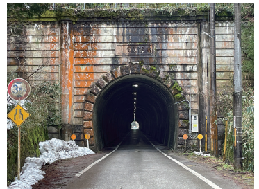
写真3 谷坂隧道東側坑口（郷野・上草野側）