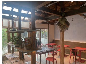
写真20 awai店内の様子(大津壁風のグレーの壁面が見える)