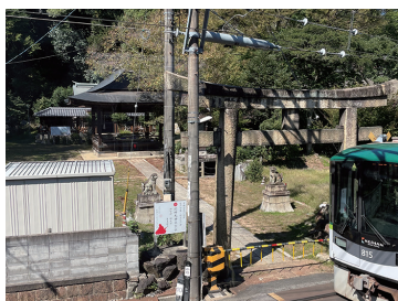
写真25 京阪電車京津線と関蟬丸神社下社