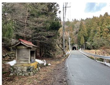
写真6 小室側坂道より谷坂隧道西側坑口を望む