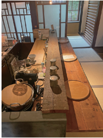
写真24 足場板を使用したバーカウンター(一階)