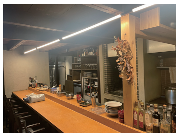
写真32 磨き仕上げのカウンターと新しい柱