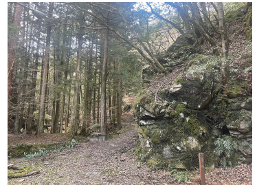
写真11 水源の方向を望む(防疫エリア)