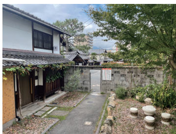
写真29 「ciocco」 外観と中庭