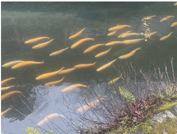
写真16 アルビノ種の集まる池