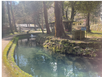
写真13 絵図に見える楕円形の飼育池