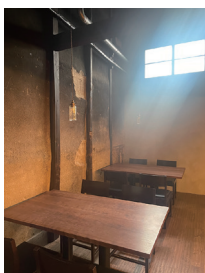
写真31 店内の壁と柱

退社後すぐに拠点となる場所の選定が始まった。高島、近江八幡、守山なども探すが、長等商店街の魅力と本要寺住職との出会いから現在の地を拠点にすると即決、築一〇〇年超の長屋二棟を借り、一棟を店舗改築した。新調したのはフロアを一段高い位