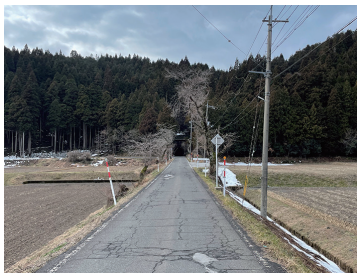
写真7 草野川側道より谷坂隧道東側坑口を望む