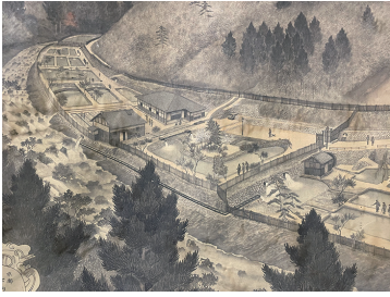
写真9 醒井養鱒場絵図