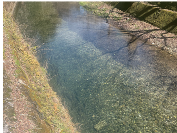
写真14 総谷川に群れをなすニジマス