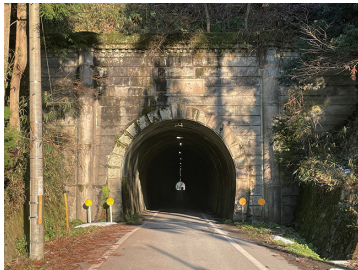
写真2 谷坂隧道西側坑口（小室・田根側）