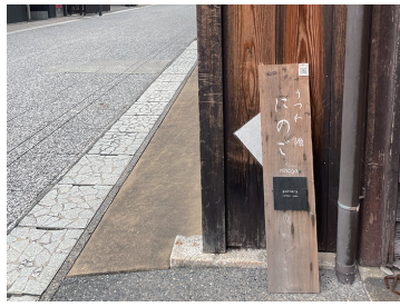
写真21 「にのこ」の看板(東海道)